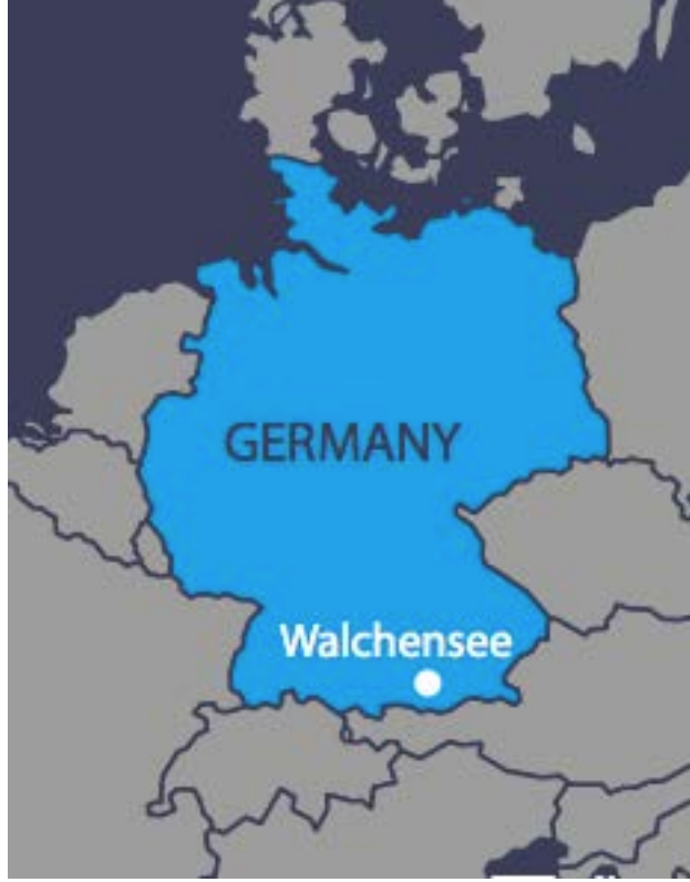
Şekil 1: Walchensee Güney Almanya bölgesinde bulunmaktadır.

Aşağı akım salınımların, çevre ve sosyal açıdan önemi 1920'li yıllarda Walchensee inşa edilirken henüz bilinmemektedir. Paydaşların artan endişeleri ve değişen sosyal talepler sonucu Walchensee'deki aşağı akım sorunu iki önemli azaltma projesi ile giderildi.