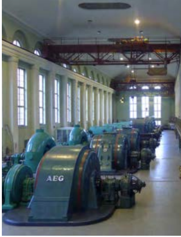
Şekil 3: Santralin içi

Yukarı Isar'ın akım rejimi, Krün'deki sapmadan beri kapsamlı analizler, görüşmeler ve tartışmalara konu olmaktadır. Konunun karmaşıklığından ötürü ayrıntılı çalışmaların yürütülmesi gerekmekteydi ve yabancı uzmanlar tarafından yürütülmüş olan kapsamlı çalışmalar, kararlaştırılan minimum akım salınımları desteklemektedir.