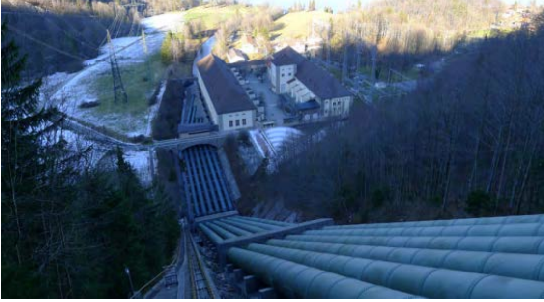
Şekil 2: Walchensee santralindeki cebri boruları

Walchensee projesi, 1920'li yıllarda ilk geliştirildiğinde aşağı akım salınımı bulunmamaktaydı. Isar üzerinde yer alan Krün'deki bir su seddi, Walchensee'ye boşalması için suyu Obernach akımına yönlendirdi. Şu anda, Obernach'ın yukarı akıntısı ve nehri Krün'ün aşağı akımında birleştiren Isar'ın bir kolu olan Rißbach'tan suyu saptıran toplam dokuz set bulunmaktadır. İki küçük çaplı santral, bu sapmadan kaynaklanan irtifadan faydalanmaktadır. Bu da Krün'de Isar üzerinde minimum akım salınımının elde edilmesini sağlamaktadır.